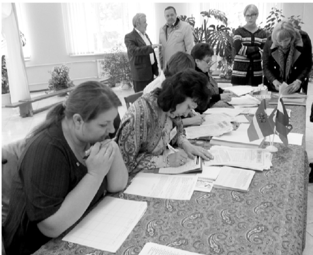
Избирательный участок в п. Бабынино.