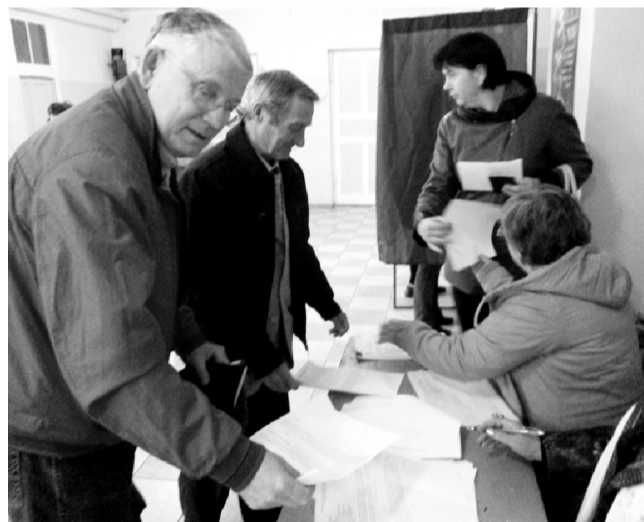
Избирательный участок в с. Бабынино.